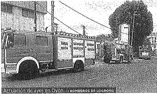
Actuación de ayer en Oyón.

SUCESOS :: LA RIOJA. Los Bomberos de Logroño intervinieron ayer como apoyo para la extinción del incendio que se declaró en una industria abandonada de Oyón, según informó el cuerpo municipal en su cuenta de Twitter. El fuego quemó materiales como muebles de oficina, madera y un falso techo, entre otros elementos.