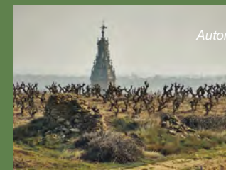
Autor: Alberto Apellániz

Irteera goizeko 9:00etan Oyón-Oiongo plaza Nagusitik. Gorrebustotik bueltatzeko autobusa doan, 13:30ean. Salida a las 9:00 h. desde la plaza Mayor de Oyón-Oion. Regreso en autobús gratuito a las 13:30 h. desde Barriobusto.