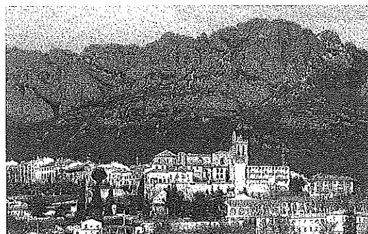
Silueta de la sierra cuyo nombre se discute.

mina 'Historia de nuestros nombres de lugar: la Sierra de Toloño' y lleva el aval nada menos que de Euskaltzaindia, el Departamento de Cultura y Política Lingüística del