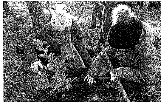
Unas niñas plantan un arbusto ayer en Laguardia.

En concreto, el número de participantes llegó hasta setenta. Entre los presentes había niños de dos años en adelante y entre todos plantaron cerca de un centenar de arbustos alrededor de la zona de La Barbacana.