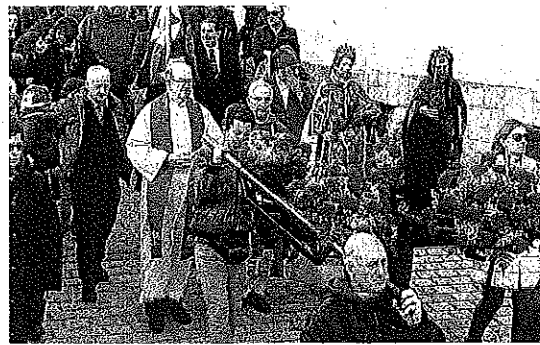
'El Katxi' volvió a protagonizar los actos festivos de Oion, que contaron también con procesiones y dantzaris.