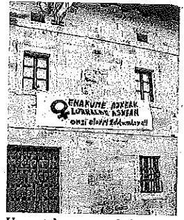
Un cartel promueve la igualdad en Zalduondo.

La ordenanza para la igualdad de Zalduondo está estructurada en 14 capítulos. En el primero se abordan cuestiones generales como el objeto y marco normativo, objetivos, ámbito de aplicación y los principios. Desde el capítulo 2 al 12