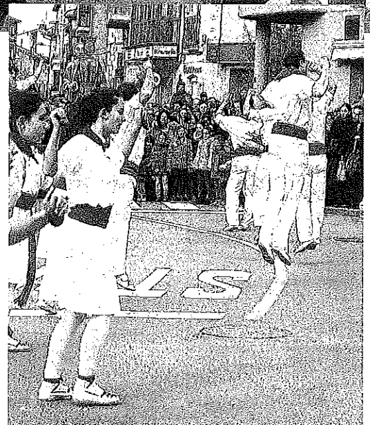
El síndico tremola la bandera sobre el Katxi . Aparte, los dantzaris en plena acción y varios curiosos con los gigantes de Oion.

Tras rodear los bloques de viviendas particulares que conforman la ruta, la comitiva regresó a la parroquia tras dos paradas más, una en la plaza y otra en la puerta de la iglesia, donde dejaron a buen recaudo los bustos de los patronos, momento en el que se prendió fuego a la mecha de fuegos artificiales colocados en un mástil sobre el que estaba el torito . Tras unos fuertes petardos, éste saltó despedido.