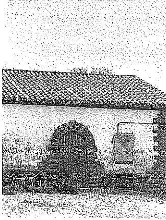
Imagen del edificio que acoge el trujal de aceite San Vicente de Oion.

ra de la casa que fundó Emigdio Marrodán en 1851 en La Rioja. La prensa hidráulica utilizada en la instalación es de columnas de acero para grandes presiones o cabezales de viga de acero forrados de chapa, que somete a los cachos a una presión de doscientas atmósferas.