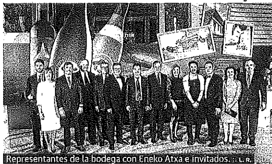
Representantes de la bodega con Eneko Atxa e invitados.

VINO DE RIOJA :: LA RIOJA. El grupo bodeguero Faustino ha puesto en marcha en Asia su proyecto 'Taste The World' con dos eventos en China y uno en Japón de la mano del chef cuatro estrellas Michelin Eneko Atxa. Más del 50% de la producción del grupo se dedica a la exportación y el mercado asiático es estratégico para la compañía.