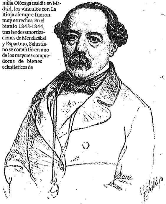
José de Olózaga, dibujado en 1855 por Vallejo y Galeazo.

la provincia. El primer año invirtió nada menos que 1.320.292 reales y el siguiente compró el monasterio arnedano de Vico en Arnedo, valorado en 3.771.305 reales. Gestionado por Salustiano hijo, el monasterio franciscano fue transformado en una confortable residencia para la burguesía y en una enorme explotación agraria, donde el vino era el producto más cotizado. También Salustiano padre invirtió en la compañía ferroviaria Tudela-Bilbao en 1857. La mencionada firma llevaría el primer tren a La Rioja en 1863.