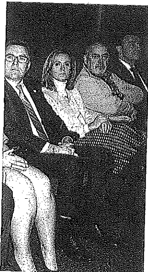
hoy, las instituciones vascas y las entidades del tercer sector dedican 47,5 millones de euros anuales a la atención de las personas sin

50 DIRECTRICES La estrategia propone medio centenar de directrices concretas que se agrupan en torno a los ya citados nueve ejes prioritarios de acción: La prevención de las situaciones de exclusión residencial grave; el desarrollo del enfoque basado en la vivienda; la mejora de los recursos y programas orientados a las personas en situación de exclusión social grave en el ámbito de los servicios sociales; el refuerzo de la perspectiva de género en las políticas de prevención y abordaje de la exclusión residencial; la garantía del acceso de las personas sin hogar a los derechos de ciudadanía mediante la regularización de su situación administrativa; mejoras sectoriales en el ámbito de la salud, la garantía de ingresos y el acceso al empleo; el acceso al ocio, la educación y a la participación social y política; mejoras en el ámbito de la sensibilización y de la implicación de la comunidad en la prevención y el abordaje de las situaciones de exclusión residencial; y medidas de coordinación, seguimiento, evaluación y gestión del conocimiento. La definición de la estrategia ha sido posible gracias a un trabajo previo de análisis de las características y necesidades de las personas sin hogar en Euskadi y de las fortalezas y debilidades de su sistema de atención, con la vista puesta también en los modelos de intervención frente a la exclusión residencial de los países del entorno. ●