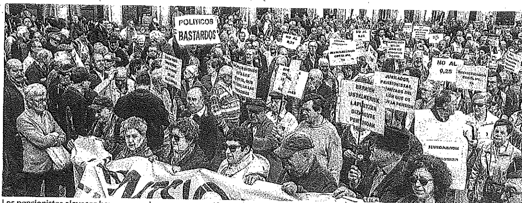
Los pensionistas alaveses han convocado una «gran manifestación» para el sábado 5 de mayo.

El territorio cuenta, además, con 6.319 personas que tienen una pensión por incapacidad permanente que asciende de media a 1.189,04 euros -el promedio nacional se sitúa en torno a los 940- y otros 1.865 alaveses perciben un subsidio medio por orfandad de 435,86 euros, que en el conjunto de España ronda los 383.