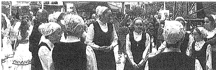
Tamborrada en Oion, caracoles en Amurrio y momento del txupinazo en Respaldiza, ayer.