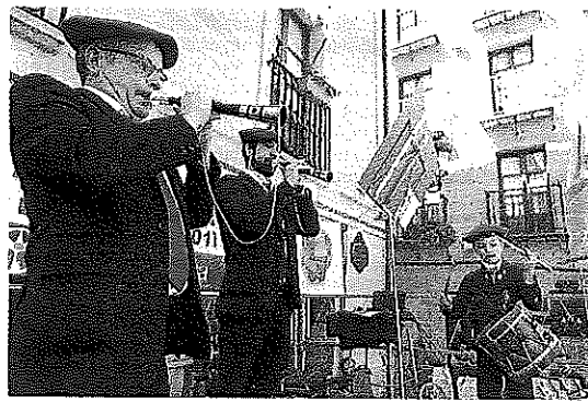
Actuación de la edición del año pasado.