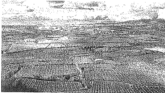
Paisaje de viñedos de Rioja Alavesa. H.E.C.

nisterial de Fomento y una de ellas sigue afectando, aun en proporciones bastante menores, a una parte de la provincia. Sea o no de refilón, la oportunidad más barata (de menor coste dentro de las millonadas, en realidad) toca a Salinillas de Buradón, que es junta administrativa de Labastida. En esta obra teatral hubo distintas presentaciones, existe un nudo y los cálculos apuntan a conocer el desenlace en julio. Solventada la bola grande de partido habrá que confiar en que ni siquiera ese meridional trozo alavés pierda el servicio. Y tampoco el resto.