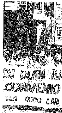
Movilización de ayer.

Los sindicatos están citados a una nueva reunión con las empresas el próximo jueves 31, un