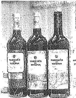
Botellas de la marca.

También se ha renovado el logotipo que adquiere un tono más moderno y simplificado favoreciendo el recuerdo de marca con una tipografía más legible y actual. La etiqueta se remata con un fondo compuesto por la ilustración en tonos azules y un escudo en estampación dorada que refuerza