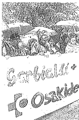
Concentración, ayer.

REIVINDICACIÓN – Los representantes de LAB, ESK, CCOO y ELA en las contrataciones de limpieza de los centros de OSI Araba (Txagorritxu, Consultas externas y centros de salud), junto con los representantes de la Junta de Personal de Atención especializada de la OSI Araba, denunciaron ayer públicamente la situación "extrema" al que, tanto desde la dirección de Garbaldi, como desde la OSI, junto con el sindicato CUT, "están llevando al conjunto de las plantillas, tanto de la propia Garbaldi como a la del Servicio Vasco de Salud, Osakidetza. – DNA