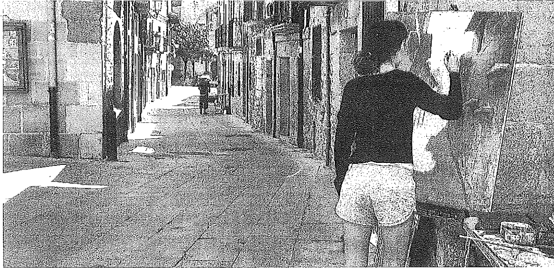
Una joven pinta un cuadro en la localidad alavesa de Elciego, donde se invertirán 1,3 millones en obras de urbanización de calles.

El propio Plan Foral de Obras y Servicios -con las actuaciones de mayor calado- ha recibido 217 peticiones, mientras el de Obras Menores ha contado con 192 propuestas y el de Veredas, con 88. De éstas, 139, 175 y