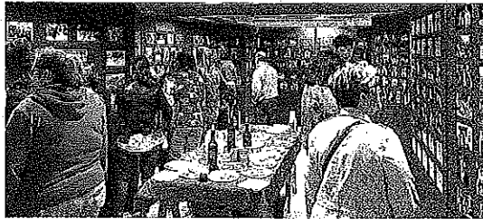
Inauguración de la exposición de la Peña. :: LOS ZABORRICOS

Laguardia serán algunas de las actividades que se desarrollarán.