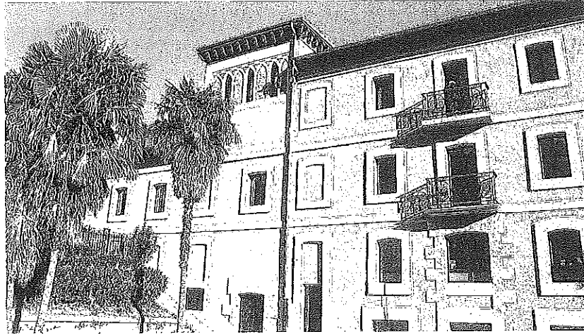
La antigua Casa del Hortelano.

Para ello, plantean concentrar la reflexión y la toma de decisiones en unas pocas semanas o meses, en las