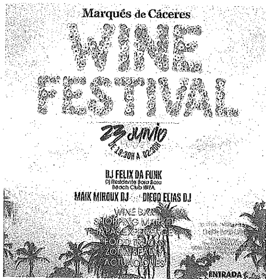
Cartel de Marqués de Cáceres.

La bodega ha reservado también para los asistentes un área de 'Tapas Experience', con varios 'Food Trucks' con comida local e internacional. Asimismo, varios cortadores de jamón ofrecerán tapas durante todo el evento, que se podrán maridar con los mejores vinos de Marqués de Cáceres disponibles en su Wine Bar. La iniciativa cuenta además con el apoyo de varias marcas de moda y decoración, que presentarán sus productos a los asistentes en este evento