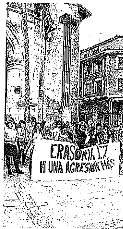
Protesta de Agurain.

Se trata de un ritual que llena de visitantes y de lugareños la plaza de San Juan y también bares, como la taberna Otxoa, en pleno Casco Viejo, donde en medio del bullicio de la noche, una joven de 20 años, como denuncia el colectivo, comprobó que en esas fiestas no todo es diversión, al sufrir "aga-