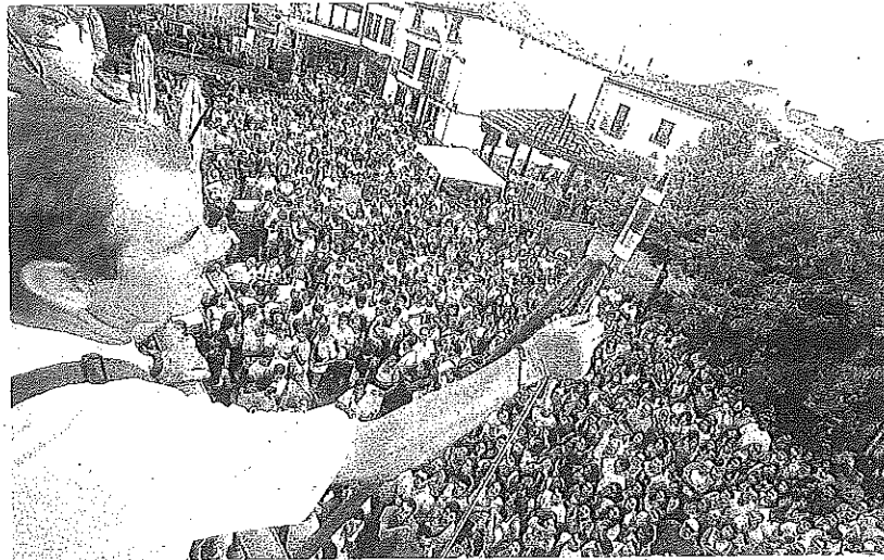
Oyón comenzó sus fiestas ayer con la bajada del Katxi y el disparo del cohete. :: JUAN MARÍN

Después de que ayer Lapuebla de Labarca acogiera el Día del Jubilado la localidad vive hoy el chupinazo con