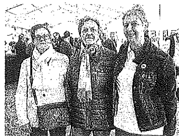
Como todos los años, desde Mungia a Foronda Maitte, Itziar e Izaskun.