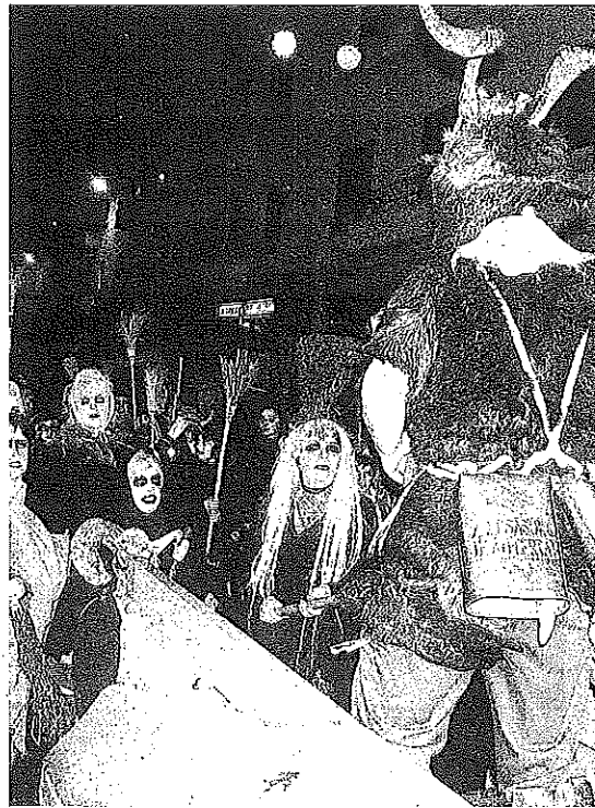
Aker y sorginak durante la celebración de un carnaval rural.

Estas sorgin gauak se cerrarán con el espectáculo Les Tambours de Feu, de la compañía Deabru Beltzak, donde Aker, el diablo del