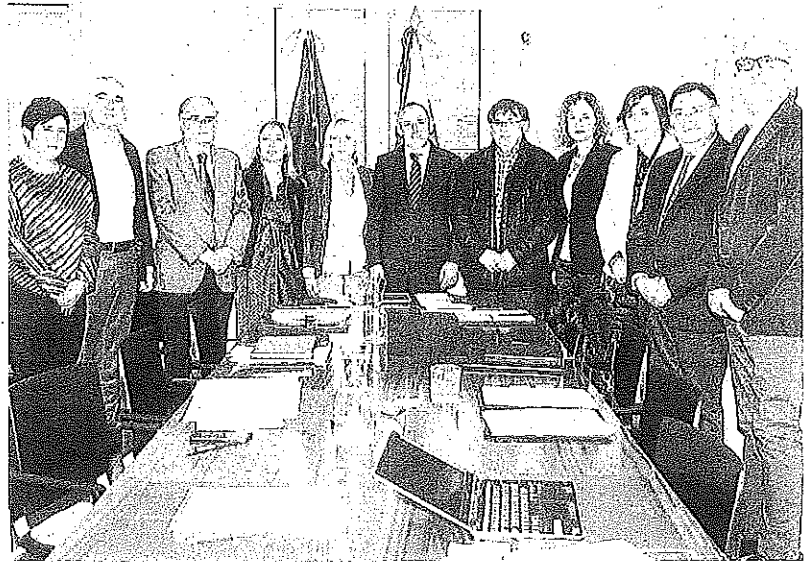
El Consejo de Gobierno Foral se trasladó ayer a la localidad de Agurain.

Por otra parte, la Diputación ha convocado un concurso para cubrir las 19 vacantes de puestos de trabajo en diferentes ayuntamientos del territorio, dirigido a funcionarios de administración local de carácter nacional. -E.S.P.