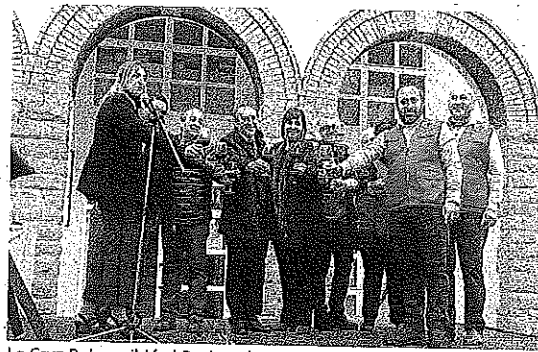
La Cruz Roja recibió el Racimo de Oro el año pasado.

Además, como indica su propio nombre, el día servirá de agradecimiento a los frutos que el campo ha deparado en esta campaña y a las personas que han hecho posible que