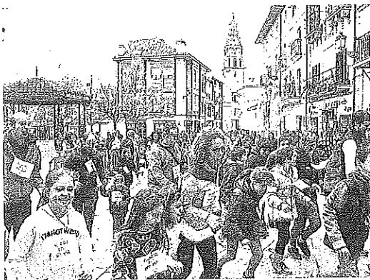
VECINOS DE OION CORREN EN FAVOR DEL EUSKERA. Más de cien personas de todas las edades se sumaron ayer a la carrera a favor del euskera organizada por el euskaltegi de Oion y los dos centros escolares de la localidad: la ikastola y el colegio público. La actividad comenzó a las once de la mañana, con la apertura de la mesa para las inscripciones en la plaza, lugar que fue acogiendo a numerosas familias.