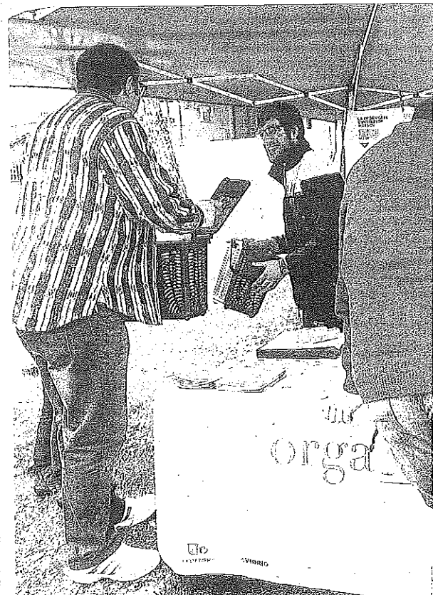
Reparto de kits de recogida de materia orgánica en Respaldiza.

Asimismo, aquellas personas que quieran adherirse a la campaña y aún no tengan su kit, podrán recogerlo en el punto informativo que se instalará en la calle Padura de Luiaondo, desde el día 24, así como en el propio Ayuntamiento de Ayala en Respaldiza y en el garbigne de Llodio. Por su parte, las familias que ya estén participando en la campaña podrán acer-