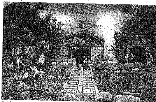
Belén articulado barroco de Laguardia. :: MIKEL

Las figuras permanecen guardadas hasta que los primeros días de diciembre aparecen en el calendario. Es entonces cuando se comienza a preparar todo, desde la estructura del escenario hasta el diseño de los decorados, pasando por el arreglo de los posibles desperfectos que puedan tener las figuras. Estas conservan los vestuarios tradicionales, aunque las representaciones han ido mejorando tanto en cuanto a ilumina-