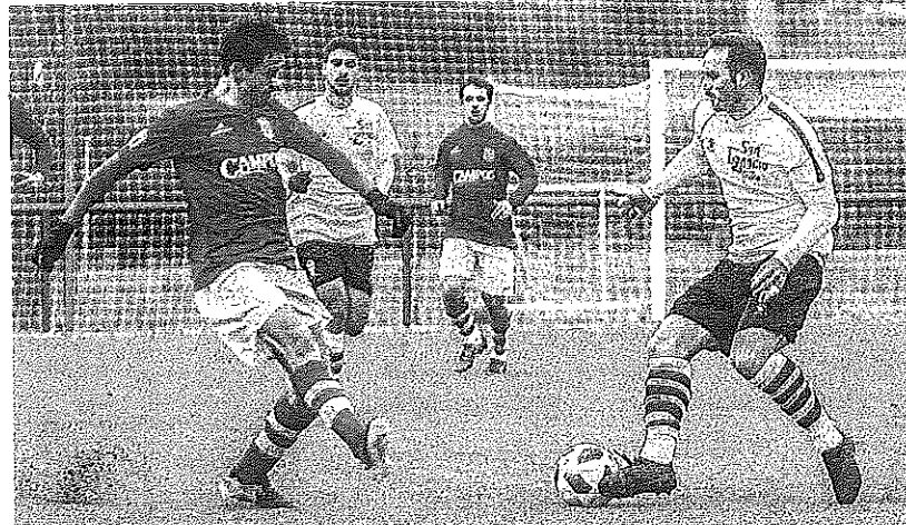
Los seis tantos del encuentro se anotaron en el primer tiempo.

Parecía todo perdido para el Amurrio. Sin embargo, el conjunto blanquiazul, que ya había avisado con un par de remates peligrosos, tiró de garra para equilibrar la contienda en la recta final, primero con un penalti transformado por Baztan y, ya en el 83, con un tanto de Ibon Gómez que dejó el resultado en el definitivo empate a tres.