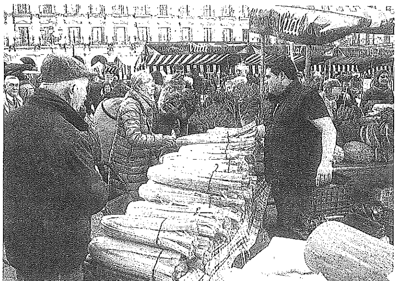
Última edición del Mercado de Navidad, que se celebrará mañana en Gasteiz.

AMURRIO – El Ayuntamiento de Amurrio ha aprobado una Oferta Pública de Empleo (OPE) para cubrir ocho puestos de trabajo, de los que tres serán de promoción interna y cinco de libre concurrencia. Las pruebas se realizarán en 2019. En concreto, las plazas a cubrir son las de tres auxiliares administrativas, un oficial de oficios y un agente de Policía. Los puestos dirigidos a la promoción interna son otra plaza de administrativo y dos de agente primero. – A.O.