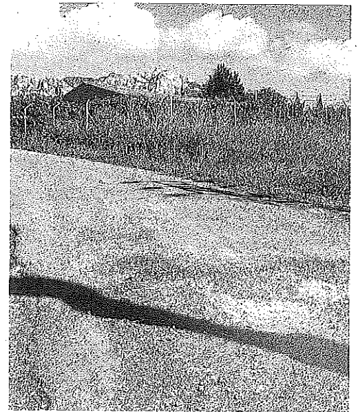
Estado actual del camino de Párganos.