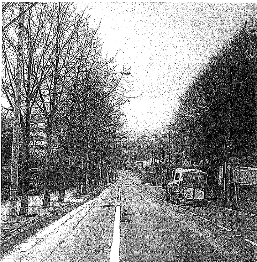
Salida de Amurrio por la calle Aldai en dirección Aldaiturriaga.