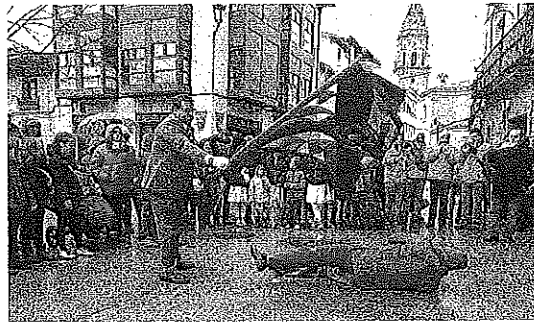
El 'Katxi' se revolcó por el suelo a pesar del agua.

De esta manera, Terroba hace una valoración «muy positiva» de los festejos y destaca varios momentos álgidos, como el de la recuperación de una tradición que data de los años cuarenta y que volvió a realizarse en Oyón este año o el de la conmemoración del aniversario de la aparición de la figura humana en la rueda del 'Torillo'. «Tanto a esos actos como al resto acudieron muchas per-