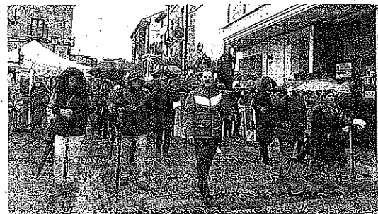
San Vicente y San Anastasio salieron en procesión.

sonas», afirma con orgullo el alcalde de Oyón. «Y es de agradecer la implicación de todos los colectivos del pueblo porque incluso los 'danzaris' salieron a bailar con sus albarcas a pesar de estar el suelo mojado», añade.