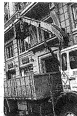
Un operario, en Fueros.

Los trabajos para instalar nuevos proyectores y luminarias empiezan en la Virgen Blanca y Fueros