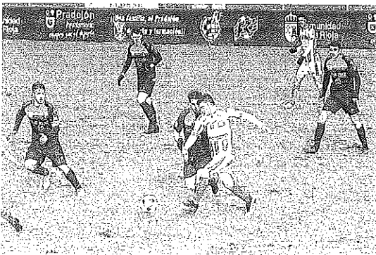
Zárate avanza con el balón ante varios jugadores de la UDL.

Al final, triunfo incontestable del Nájara que fue superior al Calasancio de principio a fin.