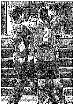
El Berceo celebra un gol.