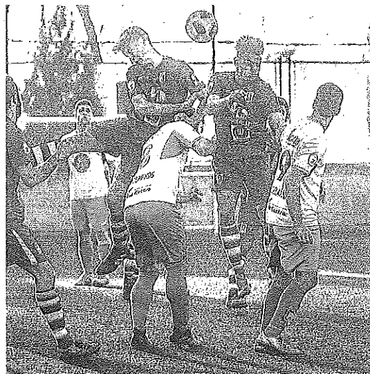
El Calasancio y la Oyonesa luchan por el balón.

una Oyonesa tratando de jugar al toque frente a un Calasancio que se decantó más por balones largos. Ninguna de las dos tácticas generaba ocasiones de gol. De hecho, hubo que esperar a los 20 minutos