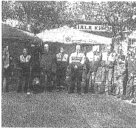
Grupo de Protección civil en el homenaje municipal de noviembre.