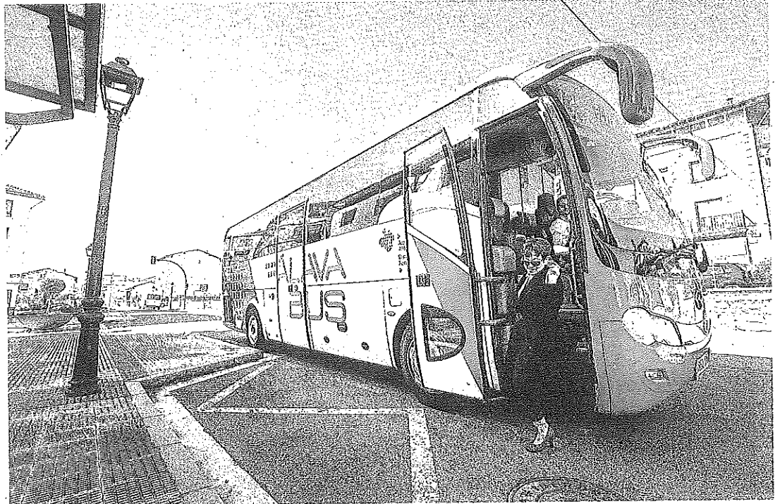
Una mujer desciende de un autobús interurbano en Nanclores de la Oca.

El Departamento foral de Infraestructuras Viarias y Movilidad realizó un estudio de las paradas de las distintas líneas de autobús para determinar sus características (distancia al núcleo urbano, lejanía respecto a determinados barrios o zonas pobladas del municipio, etc.) y po-