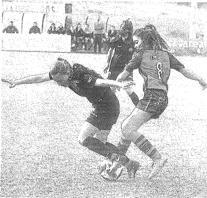
La rojilla Errasti pelea un balón con una jugadora del Mulier.

Con cuatro puntos de ventaja sobre el segundo y tercero y solo seis jornadas por delante, el panorama para las vitorianas es prometedor. En un guión del calendario disputarán sus dos próximos partidos en Ibaia, contra Pradejón y Bizkerre, que no se juegan nada. Tras ellos viajarán a casa de un Atlético Revellin que solo ha sumado seis pun-