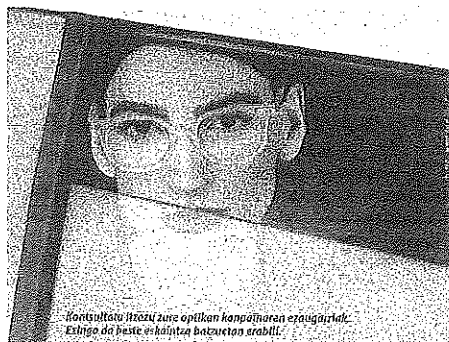
kontsultatu itzazu zure optikan konpelturaren eragugarritasuna. Ezin da beste eskaintza batzuetan erabili.

Gure betaurreko guztiak bilduna berrietakoak dira