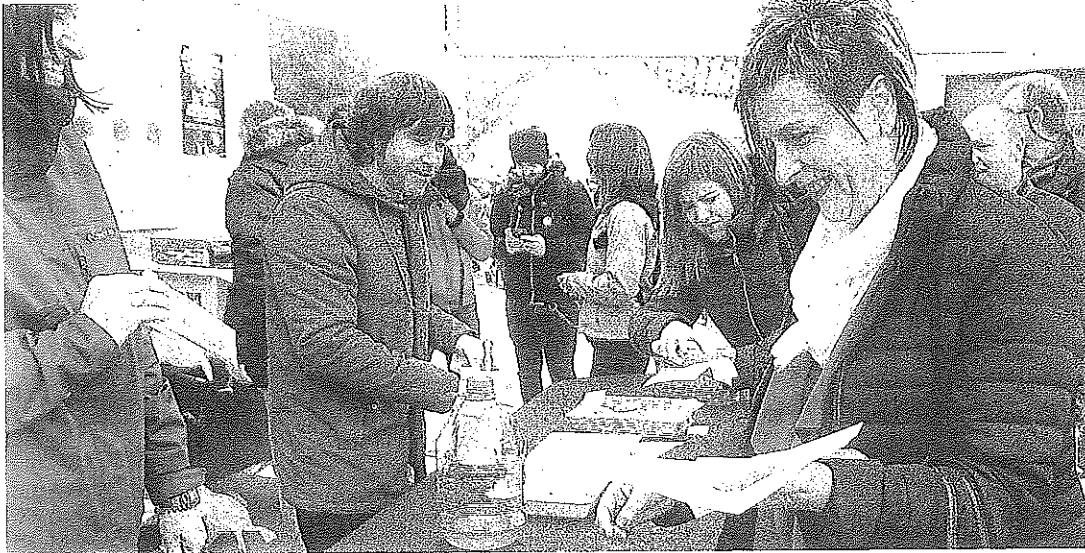
Un momento de la edición de la fiesta del año pasado, en Moreda.