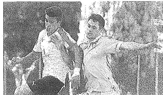
Imagen de una acción del Vitoria-Gernika de ayer.

Goles: 1-0, m. 15: Branimir, de penalti. 1-1, m. 34: Santamaría. 2-1, m. 48: Luis Lara. 2-2, m. 56: Almar.