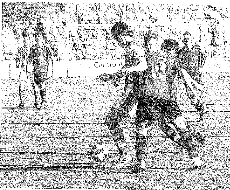
El blanquiazul Orodea trata de mantener el cuero ante el acoso de dos rivales.

Así los blanquiazules mantienen sus opciones claras de llegar al final de la liga en puestos de jugar las eliminatorias de ascenso a Segunda B, una temporada más.