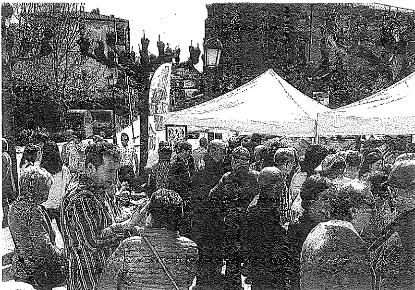
La jornada de hermanamiento llenó Idiazabal de ambiente desde primeras horas del día.