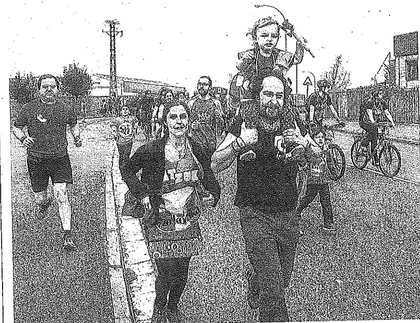
Dos instantáneas del paso de la Korrika por Álava en ediciones pasadas.

Korrika al Valle de Ayala - la ikastola Etxaurren de Ayala celebrará una diskofesta, y El Casino de Llodio albergará un espectáculo con los payasos Potxin eta Patxin (17.30 horas). Asimismo, a las 19.00 horas