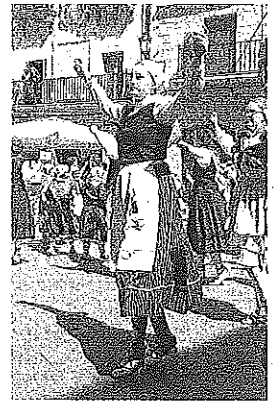
El 'Dantzari Eguna' llega a Laguardía.

Más tarde, las agrupaciones asistentes al evento bailarán en las escuelas y compartirán mesa en una comida conjunta. También habrá poteo por los bares con el acompañamiento de los músicos de Irule y la jornada concluirá con nuevas exhibiciones de baile, otro poteo con la charanga y una verbena que prolongará la actividad hasta bien entrada la madrugada.