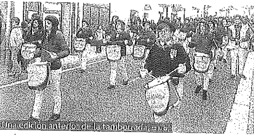
Una edición anterior de la tamborada en Moreda