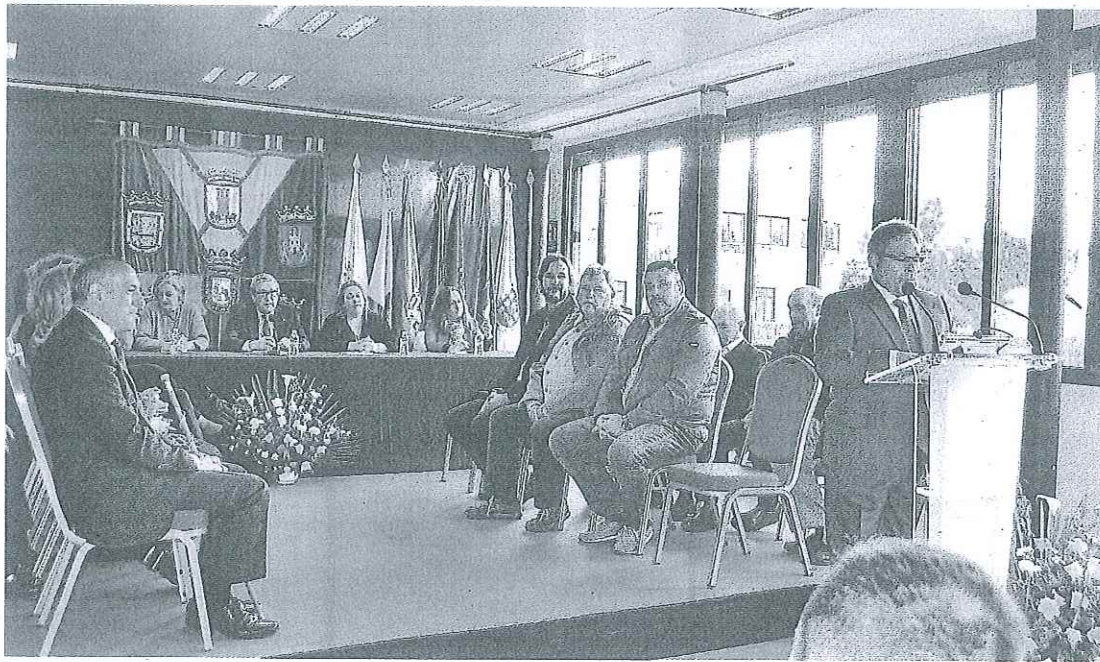
Aurreksu de honor, foto de familia e intervención del alcalde de Navaridas (dcha.)

ca, comunicaciones, transporte...". Y añadió que "tenemos que realizar una oferta de tiempo libre, cultural, deportiva, formativa; es decir, trabajar para que el vecino de Rioja Alavesa pueda