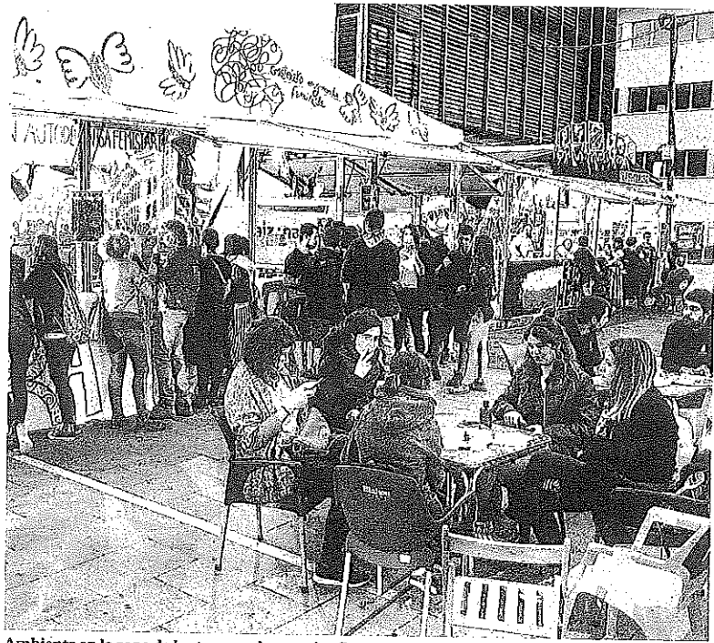
Ambiente en la zona de las txosnas durante las fiestas de La Blanca 2018.

Aulestiarte también denunció las condiciones "precarias" en las que trabaja el personal de las residencias privadas, tanto en salarios como en carga de trabajo, y mostró la solidaridad de los pensionistas con estos trabajadores, al tiempo que lamentó que "se haga negocio" con los casos de dependencia. En Bilbao, el colectivo leyó una carta dirigida a los candidatos para mostrar su rechazo al papel desempeñado por el Parlamento Europeo y las distintas instituciones de la UE debido a que "dan prioridad a las pensiones privadas cuando sólo el 27% de las personas de entre 25 y 52 años tiene un plan de pensiones privado". -Efe