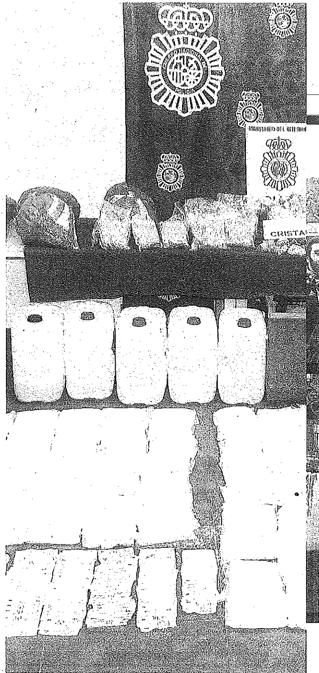
Imagen de parte de la mercancía incautada en el operativo.

En la fase final de la investigación, desarrollada en febrero de 2019, los investigadores concluyeron que el líder de la organización en la zona de La Rioja contaba con un suministrador superior a quien solicitaba grandes cantidades de droga. Se trataba del cabecilla de la organización criminal, muy conocido por los diferentes cuerpos policiales por dedicarse al tráfico de drogas a gran escala en la zona norte de España. Además,