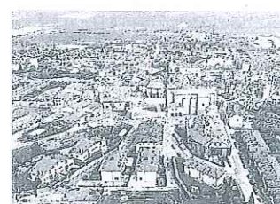
Vista de Dulantzi.