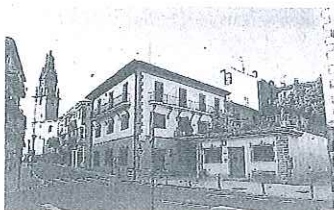
Una vista de Oion.

OION — La candidatura encabezada por el jeltzale Eduardo Terroba se impuso con claridad en Oion y permitirá al PNV seguir gobernando en la localidad más poblada de Ríoja Alavesa. Terroba concentró el 32,27% de los votos y sumará cuatro concejales, EH Bildu escala hasta la segunda posición y repetirá con dos ediles, mientras que el PSE mejora y logra un concejal más, para sumar dos. El Partido Popular, que gobernó Oion hace dos legislaturas, queda relegado a la cuarta posición y pierde dos de sus cuatro concejales. — C.M.O.