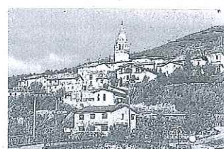
Vista de Trebiño.