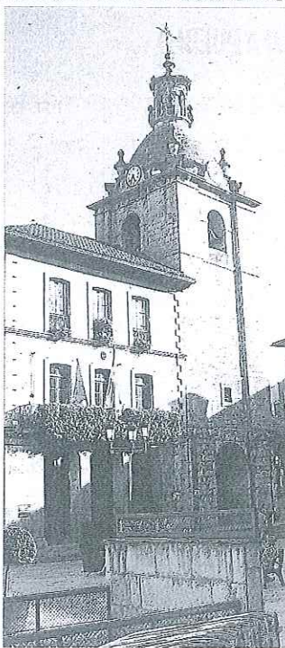
Herriko plaza de Laudio.

El PNV concentró un total de 3.581 votos y el 36,15% de los sufragios, lo que le servirá para sumar siete concejales en el Pleno, dos más que en la corporación actual. EH Bildu, que sufrió un importante retroceso en votos —2.448— y apoyos —un 24,71%—, pudo sin embargo retener los cinco concejales que ya sumaba en el Pleno. Para retener la makila , Urkixo debería sumar los apoyos tanto de Omnia como del PSE, algo del todo improbable, tercera y cuarta opción ayer en las urnas, respectivamente. La agrupación independiente pierde un concejal y se queda con tres, mientras que los socialistas, pese a su leve retroceso, consigue mantener sus dos concejales. El Partido Popular, que también en Laudio reproduce su retroceso en todas las instituciones, pierde a su único concejal. — C.M.O.